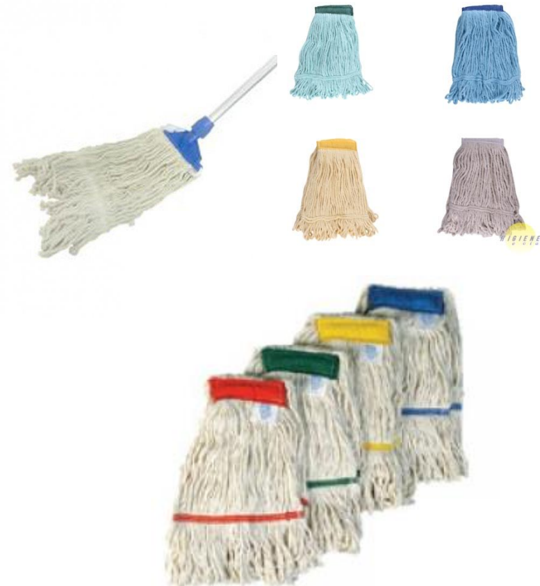
imagem demonstrativa de cores